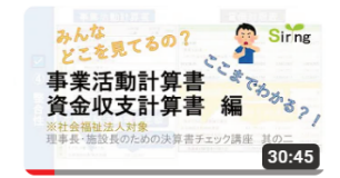
社会福祉法人会計講座 事業活動計算書・資金収支計算書編 8491 回視聴・1年前